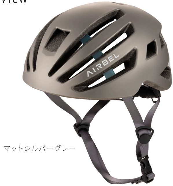
マットシルバーグレー