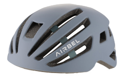
マットロシアンブルー