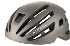
マットシルバーグレー